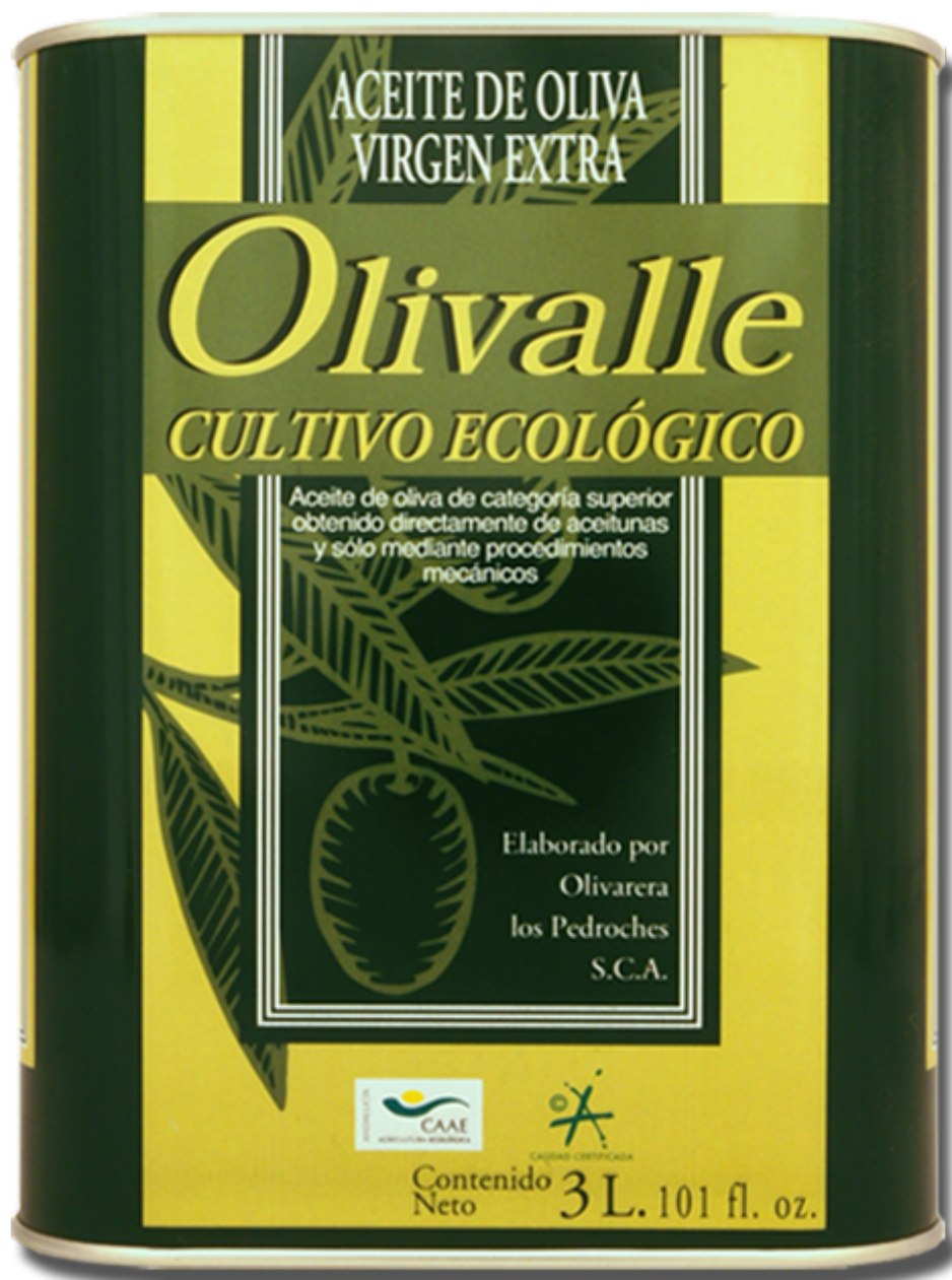
Imagen del tipo: