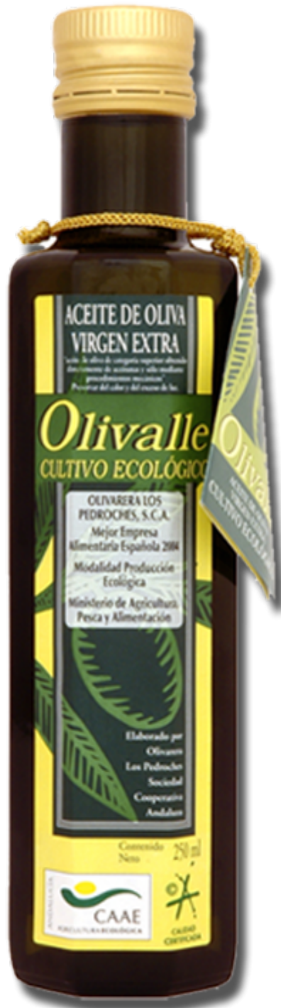
Imagen del tipo: